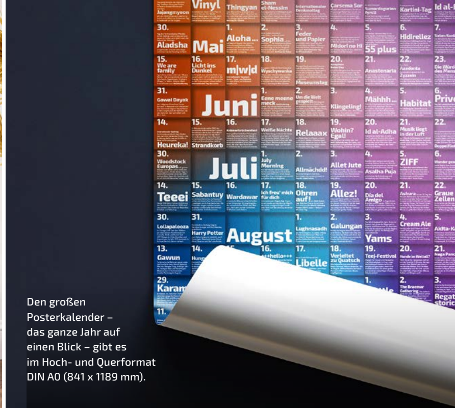
Den großen Posterkalender – das ganze Jahr auf einen Blick – gibt es im Hoch- und Querformat DIN A0 (841 x 1189 mm).

Beide Kalenderprodukte sind gleichzeitig redaktionelle Werke. Der mondali -Monatskalender und der mondali -Posterkalender zeigen Tag für Tag, was und wo gefeiert wird. Die Auswahl der Events ist bewusst arrangiert und paritätisch zwischen den Religionen, den Regionen dieser Erde und den Welt- oder internationalen Tagen verteilt.